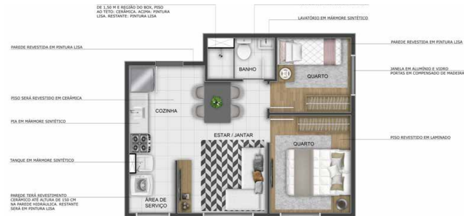
PRIMOR CARIOCA - APTO 201 - TORRE 02