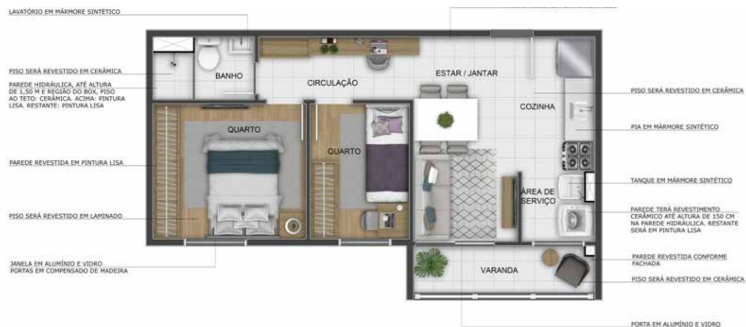
PRIMOR CARIOCA - APTO 203 - TORRE 02