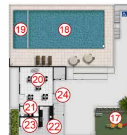
ED. GARAGEM - 2º PAVIMENTO

Castelo D'água. Manutenção de responsabilidade do Condomínio. Infraestrutura para wifi. Aparelhos e instalação não inclusos. Vaga destinada à Pessoas com Deficiência, em cumprimento à Lei de Acessibilidade. ÁGUA INDIVIDUALIZADA: preparação para medição de água individualizada. Ligação e cobranças individualizadas conforme regras da concessionária local. INTERFONE: será instalado sistema de intercomunicação entre guarita e unidades privativas, que funcionará através da rede de telefonia móvel (a contratação da operadora é de responsabilidade do cliente e do condomínio) ou pelo sistema tradicional com cabeamento. O método de construção das paredes internas do imóvel será em Drywall. Para mais informações, consulte o Memorial Descritivo do seu empreendimento. Imagem ilustrativa com sugestão de decoração. Os móveis, objetos, revestimentos e demais acabamentos não fazem parte do Contrato. Verifique se seu bloco/torre será entregue com acabamentos diferenciados. Imagem sujeita a alterações devido ao desenvolvimento do projeto e compatibilizações técnicas. Infraestrutura para ar-condicionado. Aparelho e instalação não inclusos.